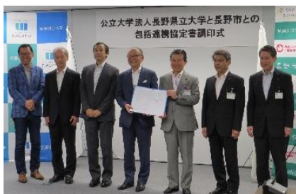
[包括連携協定（長野市）]