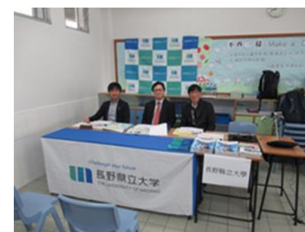
[日本大学連合学力試験面接（香港）]