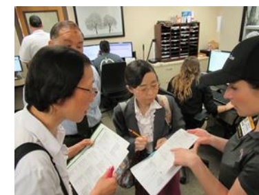
[ミズーリ大学コロンビア校・現地視察]