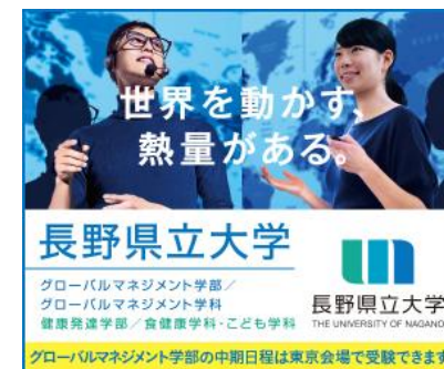
[サーチャータゲティング広告]

また、ターゲットを絞ったサーチャータゲティング広告（本学と競合する大学をWEB検索した18-21歳ユーザー（受験生）に対し、広告が表示される）や新聞系出版社が発行する進学情報誌への特集記事（朝日新聞出版・AERA）の掲載など、知名度向上のための取組を行った。