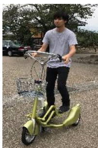
[ウォーキングバイシクル]