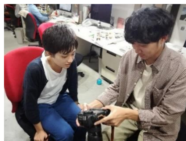
[インターンシップの様子]

平成30年度については、学生がまちなみカントリープレス (出版社) のインターンシップに参加し、主体的に就業体験を積む機会を持った。