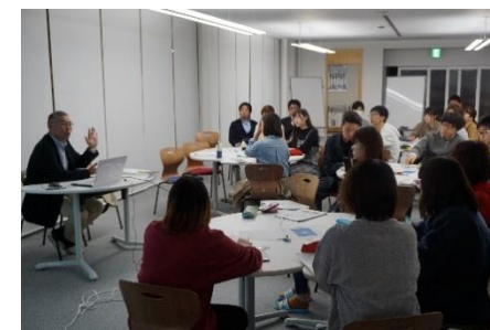
【象山未来塾の様子】

寮での学習サポートの一環として、キャリアセンター主催の「象山未来塾」を計7回開催し、延べ129人が参加した。象山未来塾は、教員や企業、地域住民をゲストに寮生と語り合い、イノベーションの思想に触れることで、自分のキャリアを考えるための教育課程外プロジェクトとして位置付けている。参加者の満足度は100%（終了後のアンケートより）と高い学習効果を上げることが出来た。