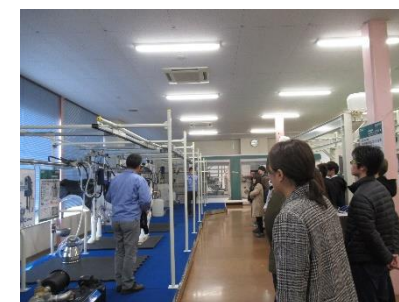
[GM学科による企業訪問の様子]

県内企業等との連携を通じて学生の学修機会を充実させることにより、プログラム後の学修成果の共有や、本学の産学連携促進に寄与することが期待できる。