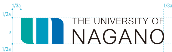
ユニバーサルメッセージなし