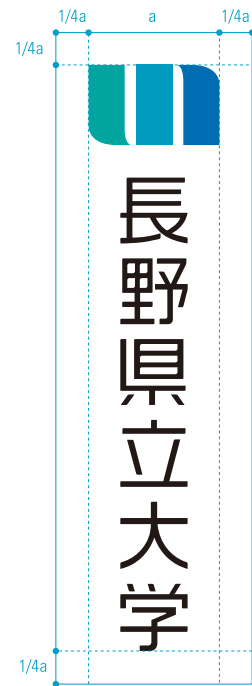
ユニバーサルメッセージなし